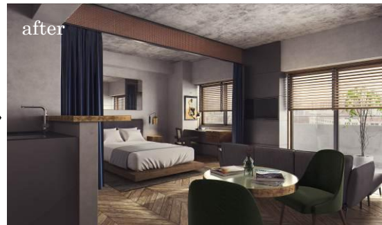
サービスアパートメント イメージ