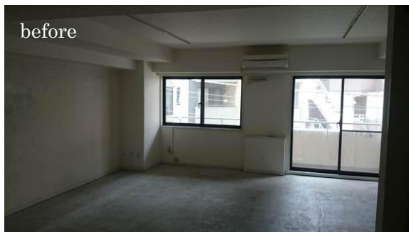
コンバージョン前