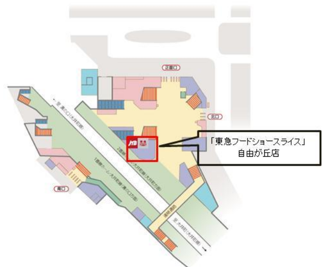
▲自由が丘店位置図