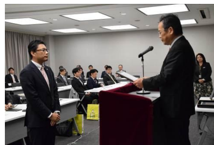
▲健康経営推進賞の授賞式様子

※「WalkBiz」(ウォークビズ)スタイル:歩きやすい靴で通勤・勤務するスタイル。ひと駅歩くことや階段を上ることで、職場を運動環境に変える取り組み。