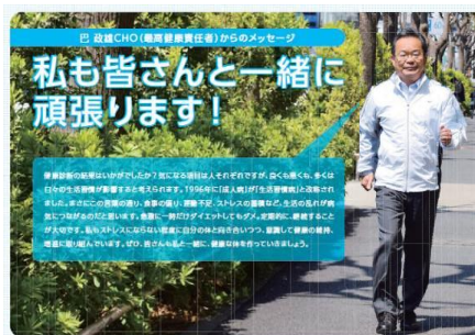
▲社内報にてウォーキングを推奨するCHO

当社は今後も、当社ならびに連結子会社の従業員とその家族の健康を企業価値の向上につなげるだけでなく、東急病院や生活サービス事業の展開により、東急線沿線のお客さまにも健康サービスを提供し、沿線価値の向上、さらには地域・社会への貢献に取り組んでいきます。