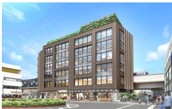
【バスロータリーから見た外観イメージ】

(※SOHO…「Small Office Home Office」の略称で、小さなオフィスや住宅をオフィスとする人たち)