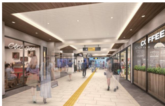
【自由通路イメージ】

(※SOHO…「Small Office Home Office」の略称で、小さなオフィスや住宅をオフィスとする人たち)