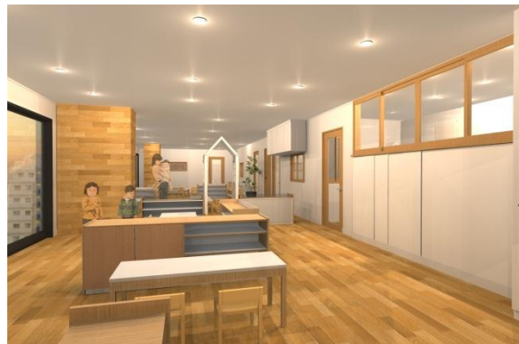
▲KBC ほいくえん祐天寺内装イメージ

(参考)目黒区の保育所など入所待機児童数、保育施設の定員数の推移(各年4月1日現在) (人)