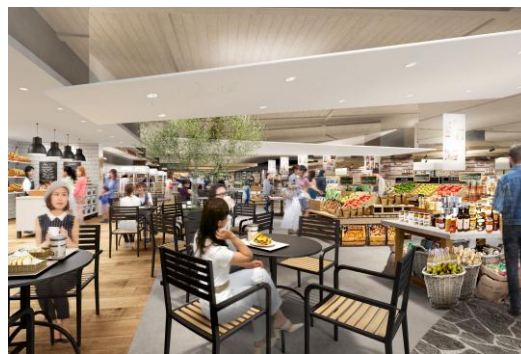
▲「食」のエンターテイメント空間イメージ