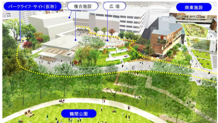
▲パークライフ・サイト(仮称)イメージ(鶴間公園側から見る)

「パークライフ・サイト(仮称)」を中心に、まち全体を一体的に活用したイベントやワークショップも展開し、繰り返し訪れたい新しいにぎわいを創出します。