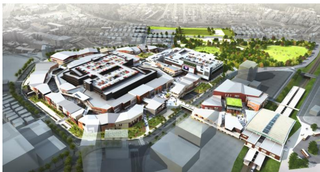
▲本計画 俯瞰イメージ