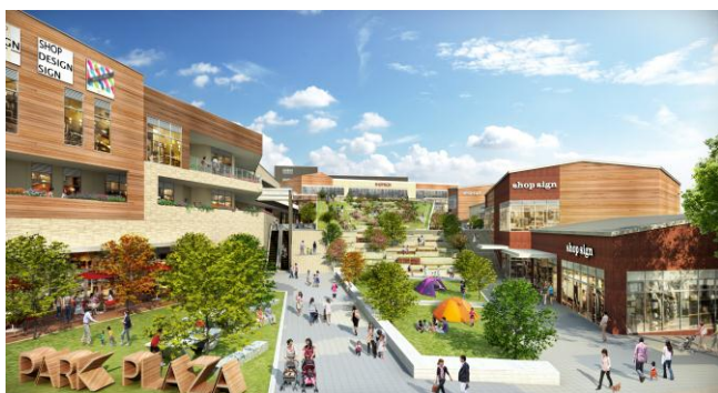
▲隣接する鶴間公園につながる自然豊かな広場イメージ