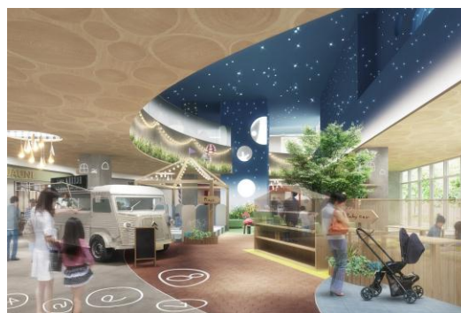
▲「遊び」のエンターテイメント空間イメージ