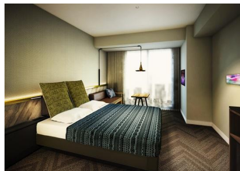
▲ゲストルームイメージ