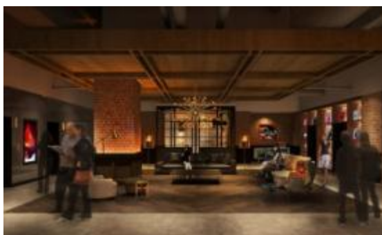
▲4階ロビーラウンジイメージ

東急電鉄と東急ホテルズは、本ホテルを通じて、増え続ける観光客やビジネス客の滞在を支えるとともに、宿泊ゲストをはじめ、本施設内に整備されるオフィスやホール利用者の交流空間としての役割を果たすことで、東急グループが目指す「エンタテインメントシティ SHIBUYA」を軸とした、新しい渋谷カルチャーを発信していきます。