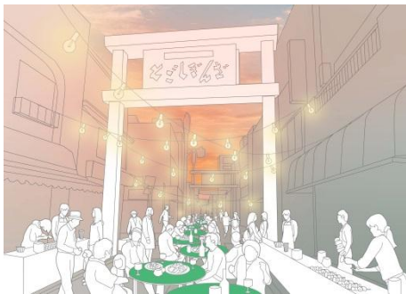
▲戸越銀座駅ストリート・ビュッフェ※画像はイメージです