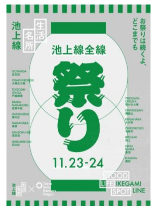
▲本イベントキービジュアル