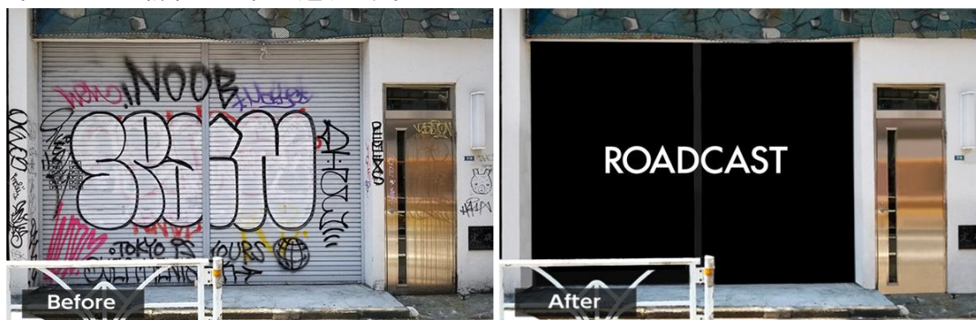
▲ROADCAST 展示 BEFORE イメージ

当社は、今後も本イベントのような企画を通じて、渋谷の情報発信力を高め、いつ訪れても旬な情報に出会えるような、「渋谷ならではの」体験ができる街にすることで、「エンタテインメントシティ SHIBUYA」の実現を目指します。本イベントの詳細は別紙の通りです。