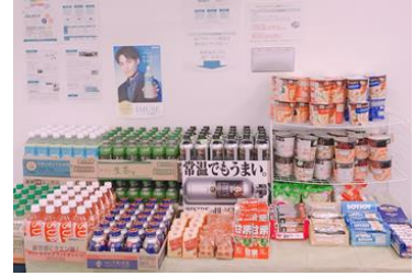
▲軽食・飲料の提供

今後も、東急線各線の朝のピーク時間帯の混雑緩和、社内の働きやすい環境づくりと生産性向上を重要な課題と位置づけ、東急グループ一丸となって、恒常的な「スムーズ Biz」の取り組みを実施していきます。