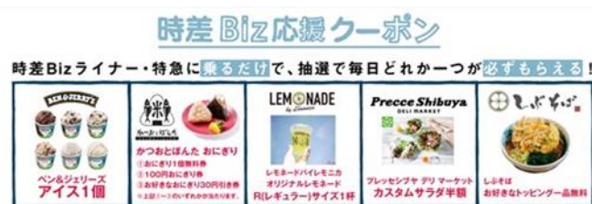
▲時差Biz応援クーポン