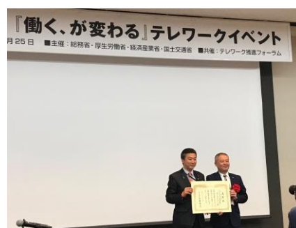
▲輝くテレワーク賞 表彰(11月25日)