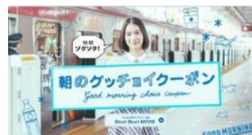
▲グッチョイクーポン

※現在、東急線沿線のオフピーク通勤の普及啓発・支援に関しては、東急電鉄株式会社を中心に取り組みを進めています。