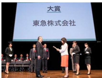
▲スムーズBiz推進大賞 表彰(11月18日)

また、厚生労働省が主催し、テレワークの活用によって、労働者のワーク・ライフ・バランスの実現において顕著な成果をあげた企業などを表彰する、「輝くテレワーク賞」において、テレワークの導入に当たって、さまざまな工夫を凝らすなど、他の企業・団体の模範となる取り組みを行う企業として「特別奨励賞」を受賞しました。