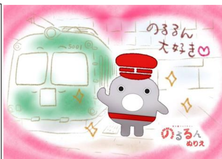
▲Twitterに投稿いただいた「のるるんぬりえ」作品例