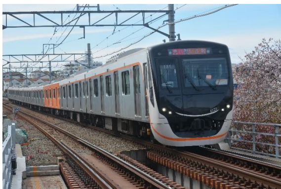
▲大井町線所属車両 6020系