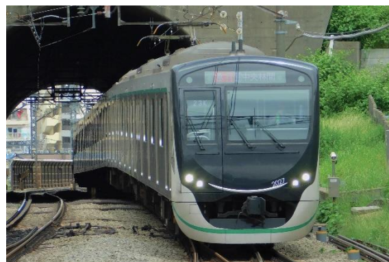
▲田園都市線所属車両 2020系