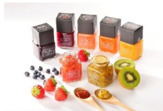
手作り工房Poco a Poco