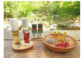
アカオハーブ&ローズガーデンハーブ工房