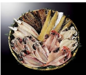
ふじのくにさすよ