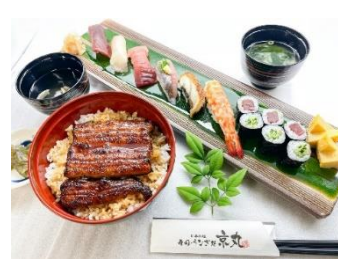
日本料理 寿司・うなぎ処 京丸 三島店