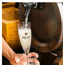
ワイン食堂 VINSENT 三島店