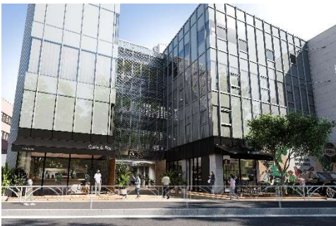
▲the Folks BY IOQ 外観イメージ