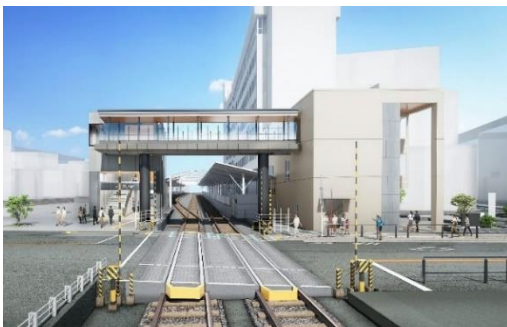
▲奥沢駅全体イメージ