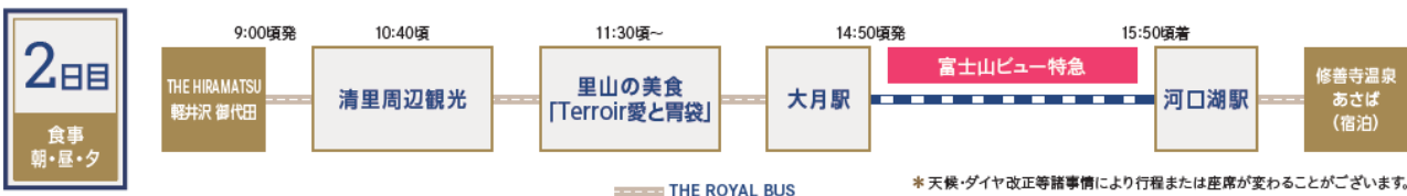
里山の美食「Terroir 愛と胃袋」