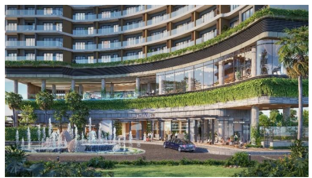
▲エントランス外観