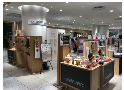
▲売り場のイメージ