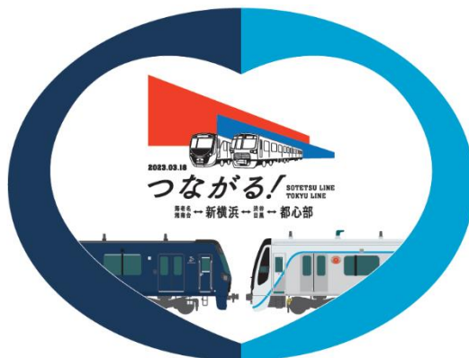
▲車両への掲出イメージ(上)と、東横線(左下)・目黒線(右下)の各車両に掲出するヘッドマークのイメージ