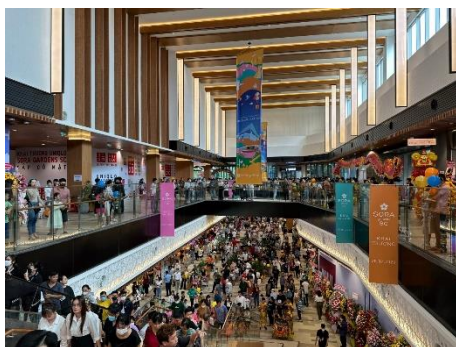
▲開業後、多くのお客さまで賑わう様子