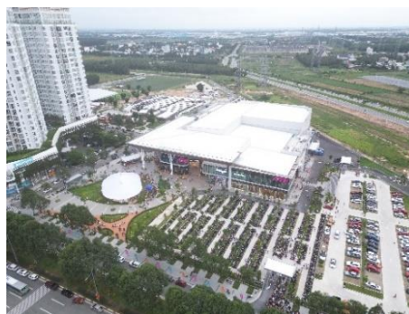
▲ビンズン新都市初のショッピングセンター