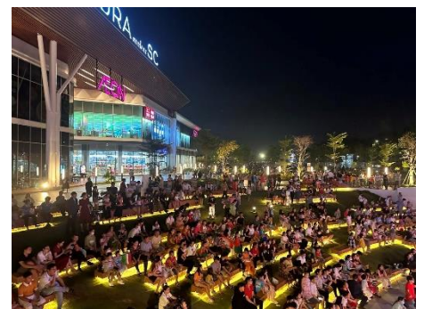
▲屋外イベントスペースで様々なイベントを実施