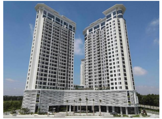
▲SORA gardens II

施設概要:商業施設(レストラン、カフェ、コンビニ等) 店舗面積:約460㎡ 店舗数:3店舗 開業時期:2019年10月