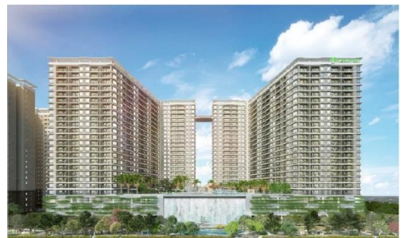
▲MIDORI PARK The GLORY(イメージ図)