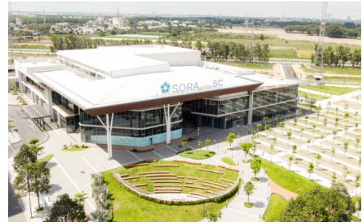
▲SORA gardens SC