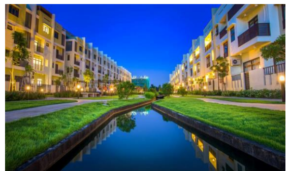
▲MIDORI PARK HARUKA