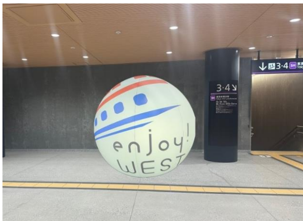
▲本映像ショーイメージ(一例)