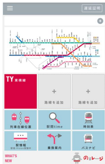
通常時「トップ画面」