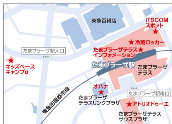
受け取り施設 地図