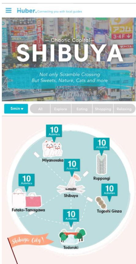
東急線沿線のツアーページ(スマートフォン)

このサービスにより、個々の旅行者が何を求め何に感動するのかを直接知ることができ、まだ広く知られていない地域の隠れた魅力を発信していくことができます。