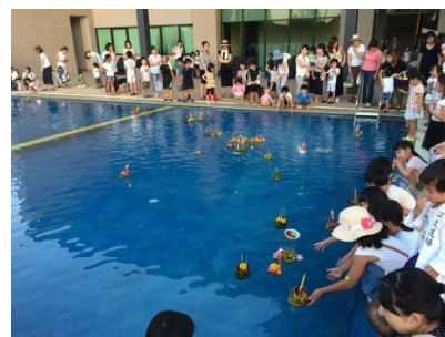
タイの伝統行事ロイクラトン