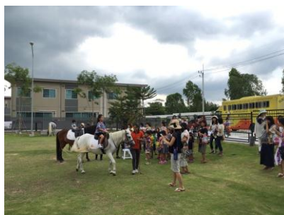
敷地内公園での乗馬体験