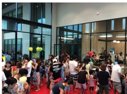
ハーモニック秋祭りの様子