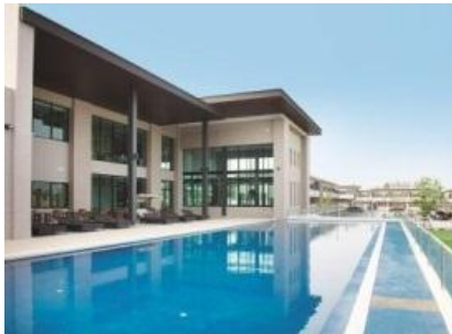
▲スイミングプール