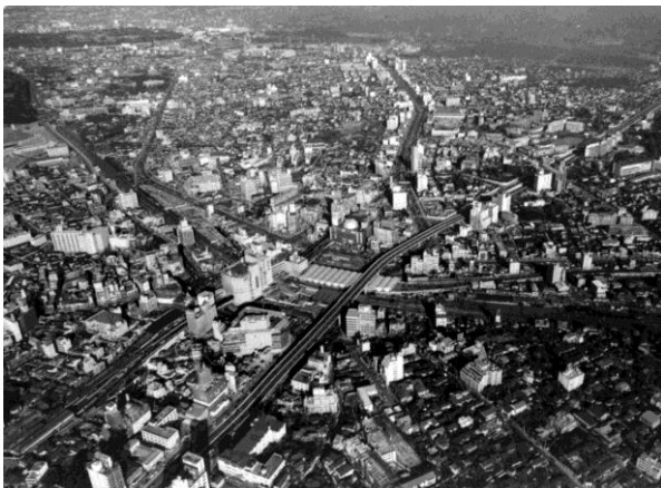
1983年ごろの渋谷駅周辺

商業・文化施設など、さまざまな施設が誕生しながら、その姿を変え進化してきた渋谷の街の姿を、前回東京オリンピックが開催された1960年代から現在まで、当時の写真などを用いて紹介します。そして、現在、渋谷駅周辺において行われている「100年に1度」とも言われる大規模再開発について、開発後の街の姿を紹介。東急グループが関係機関と協力して推進している7つのプロジェクトについて、イメージパースなどを用いて紹介するとともに、さらに快適で移動しやすい街の実現に向けた渋谷駅周辺整備の取り組みについても紹介します。