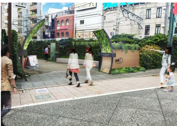
【エントランスイメージ】