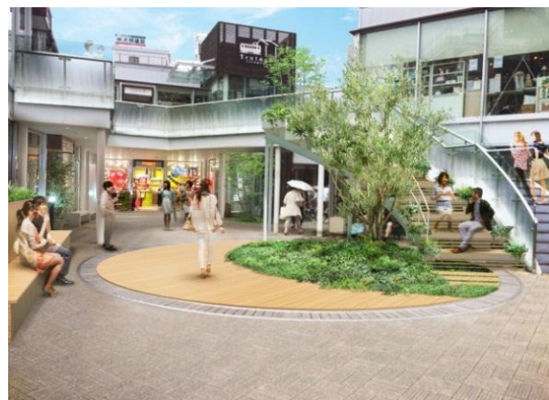
【中央広場イメージ】