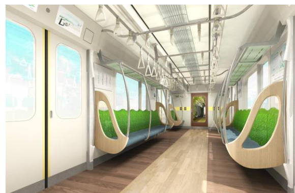
▲6020系 インテリアイメージ