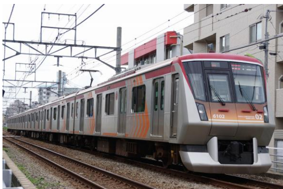
▲7両化される急行専用車両6000系

安全・安心に利用できる鉄道を目指し、ホーム上の安全対策として、2019年度までに東横線・田園都市線・大井町線全64駅のホームドア整備を目指しています。今年度大井町線では、荏原町駅および九品仏駅でホームドアの運用を開始する予定のほか、荏原町1号踏切や緑が丘3号踏切には、3D式踏切障害物検知装置に更新を行うなど、路線全体の安全対策の強化を進めます。