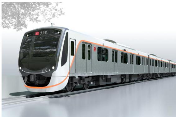
▲6020系 エクステリアイメージ