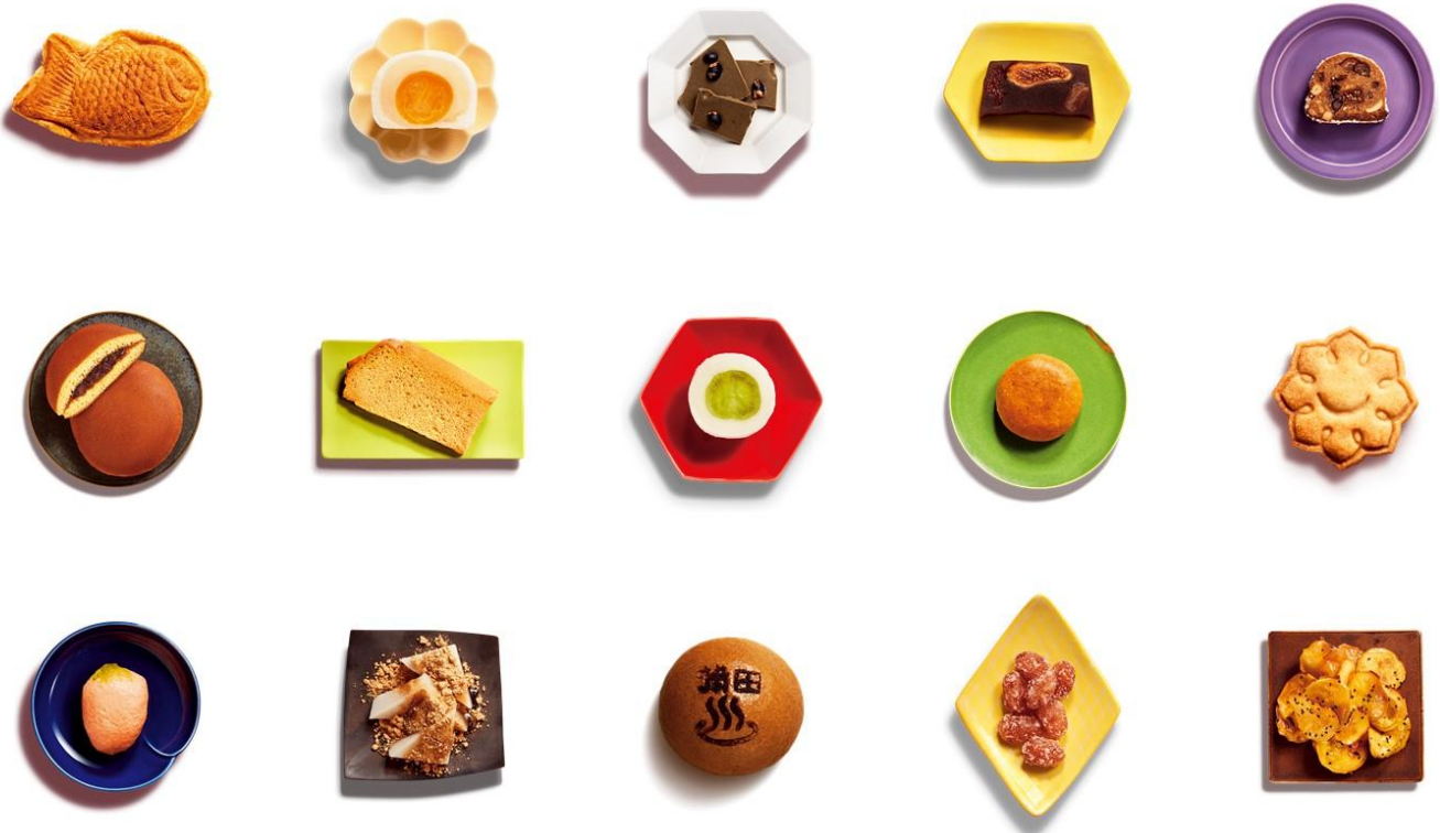
▲和スイーツイメージ

そのような和スイーツの名店が、池上本門寺に集結。中でも、古民家カフェ蓮月(池上駅)、和菓子処清野(蒲田駅)では、わフェス限定のオリジナル和スイーツを創作し、提供します。わフェス限定なので、食べられるのは11月11日(土)と12日の2日間だけです。和スイーツ好きには食べ逃せない一品となっております。