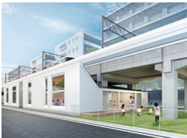
▲綱島こども園(仮称)イメージ図