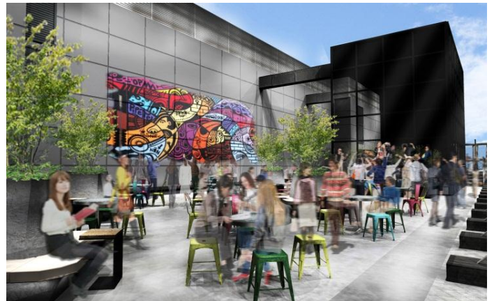
屋上詳細イメージ