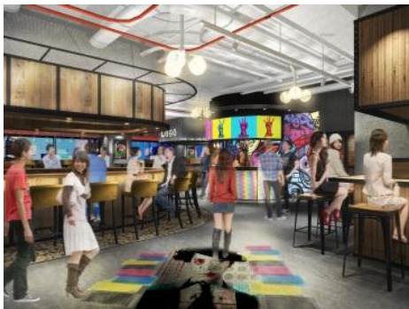
7階フロアイメージ