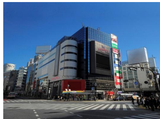
※画像は一部イメージであり、変更になる場合があります