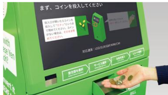
▲「ポケットチェンジ」利用イメージ