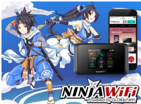
▲NINJA WiFi イメージ