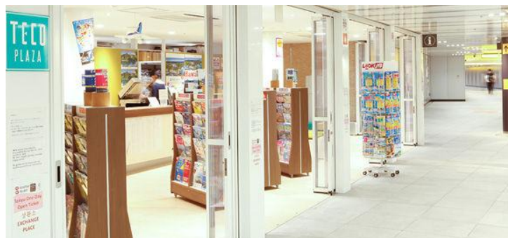
渋谷ちかみち総合インフォメーション