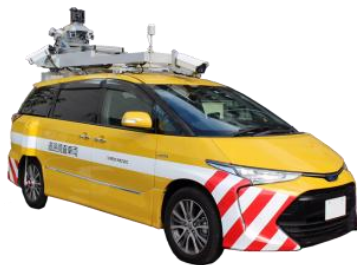
3次元点群データ計測車両

今回の実証実験を機に、計測・運用方法や精度をさらに向上させ、鉄道の新しい技術として事業化するほか、空港など他分野の技術開発も行います。本実証実験および鉄道版インフラドクターの詳細については別紙のとおりです。