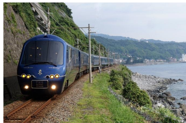
伊豆観光列車「THE ROYAL EXPRESS」