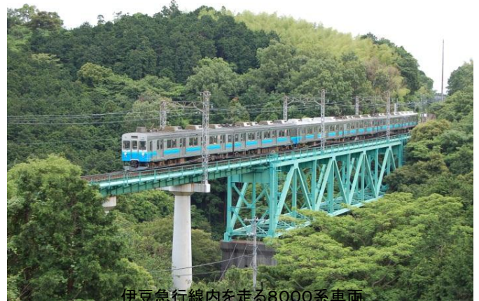
伊豆急行線内を走る8000系車両