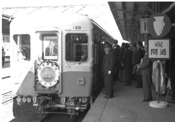
五島慶太の遺影を乗せた1番列車(伊東駅)

また、2017年7月には、伊豆急行と東急電鉄が共同で、伊豆観光列車「THE ROYAL EXPRESS」の運行を開始し、伊豆地域の活性化に取り組んでいます。