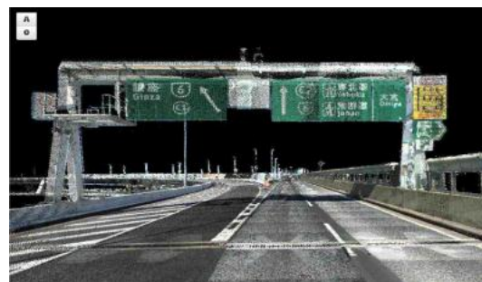
3次元点群データ使用例