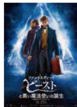
▲サイン入りポスターイメージ