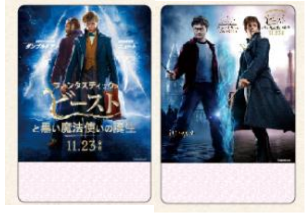
▲おとな(左)／子ども(右)イメージ