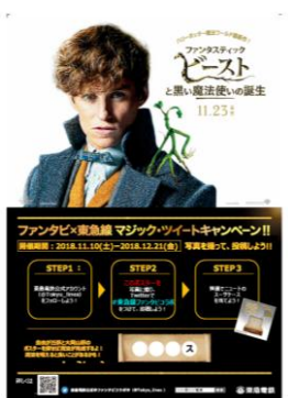
▲ステッカーイメージ

対象のツイートをリツイートし、東急電鉄公式アカウント(@Tokyu_lines)をフォローしていただいた方の中から抽選で4名さま(各期間2名ずつ)に「サイン入りポスター」をプレゼントします。