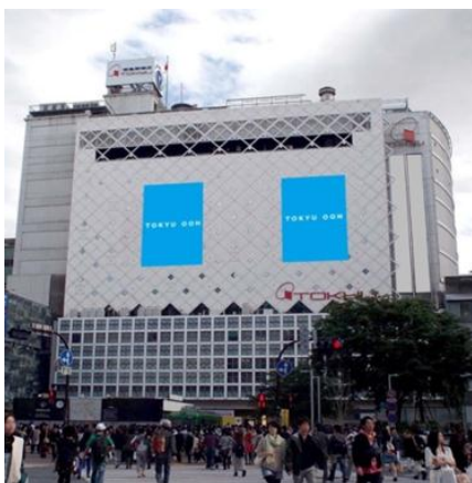
▲ハチ公・南館ビッグシート(ハチ公サイド)