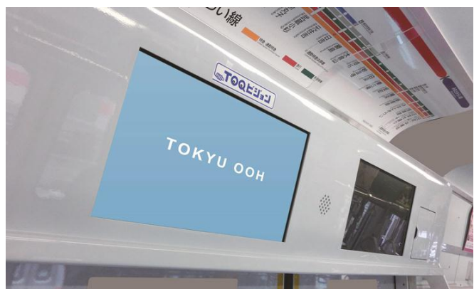
▲TOQ ビジョン(車内液晶モニター広告)