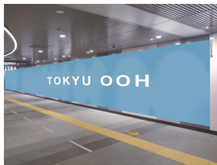
▲「ビッグサイネージプレミアム」(イメージ)

※1 COB=Chip On Board: LED発光チップを集積して基板にパッケージングしたLEDパネルです。視認角度、耐衝撃性、表示面防水性などにおいて、従来のSMD方式を凌駕する新世代LEDディスプレイです。 ※2 ファインピッチ: 2mmピッチ以下の高精細LEDディスプレイ ※3 2017年度各鉄道会社公表データより作成