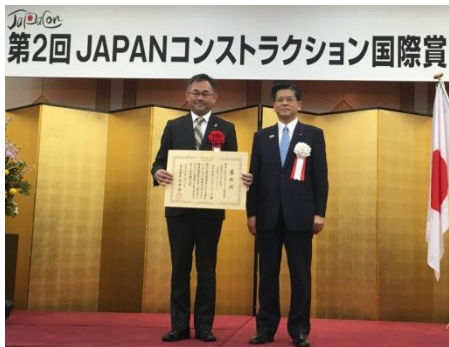
石井国土交通大臣による表彰状の授与 SORA gardens I (ソラガーデンズ1)