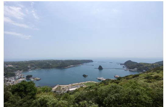
▲寝姿山山頂からの下田湾眺望