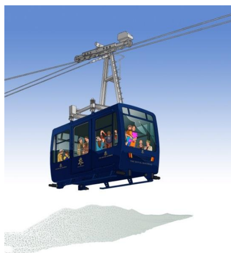
▲下田ロープウェイゴンドラ外観イメージ