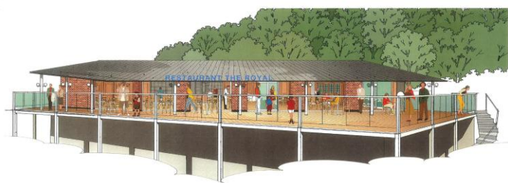
▲下田ロープウェイ頂上レストラン外観イメージ