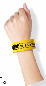
▲リストバンド型 1日乗車券イメージ

きっぷ有効日に対象店舗でのリストバンドの提示により、割引などの特典が受けられます。