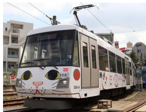
▲玉電110周年記念イベント運行時の招き猫電車