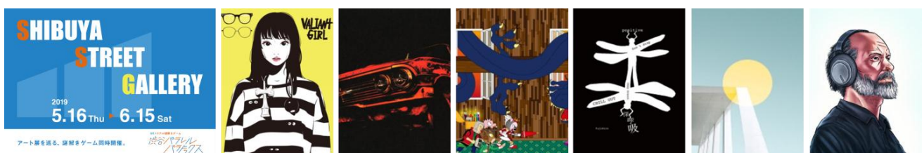
▲本イベントポスター(左)・展示アート作品例6点

当社は、今後も本イベントのような企画を通じて、渋谷の情報発信力を高め、いつ訪れても旬な情報に出会えるような、「渋谷ならではの」体験ができる街にすることで、「エンタテインメントシティ SHIBUYA」の実現を目指します。本イベントの詳細は別紙の通りです。