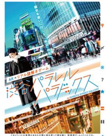
▲謎解きキットイメージ