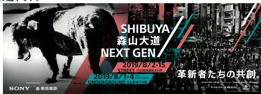
▲「SHIBUYA / 森山大道 / NEXT GEN」キービジュアル

当社は、今後もさまざまな企画を通じて、渋谷の情報発信力を高め、いつ訪れても旬な情報に出会えるような、「渋谷ならではの」体験ができる街にすることで、「エンタテインメントシティ SHIBUYA」の実現を目指します。本プロジェクトの詳細は別紙の通りです。