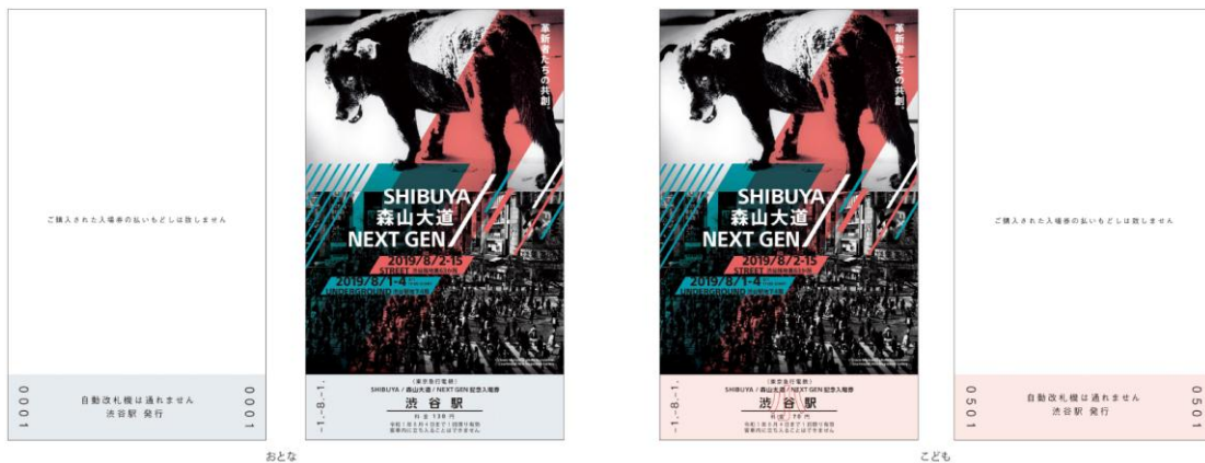
▲記念入場券イメージ(大人130円/小人70円)

※記念入場券の発売時間、場所など詳細については、オフィシャルサイトにて後日ご案内します。