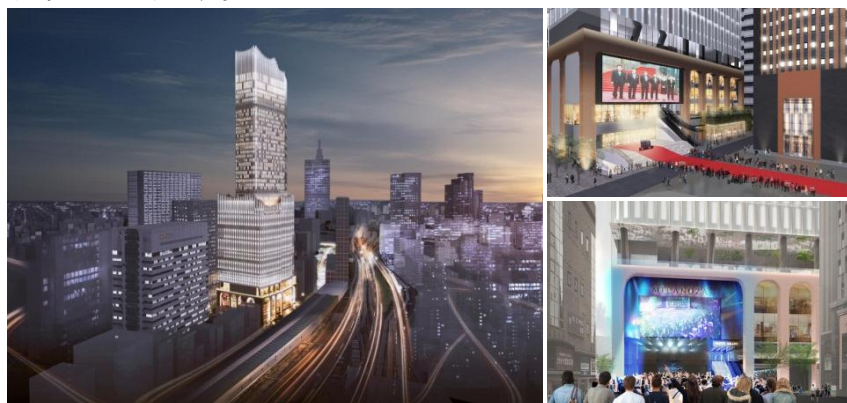
▲大久保方面(北西側)からの眺望イメージ