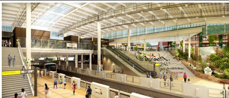
▲「南町田グランベリーパーク駅」駅舎リニューアル完成後イメージ

・現在、計10本運行している平日18～20時台の大井町発田園都市線長津田行の急行列車を新たに3本増発し、計13本運行