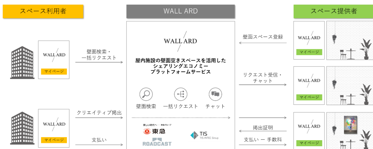
▲WALL ARD サービスの仕組み