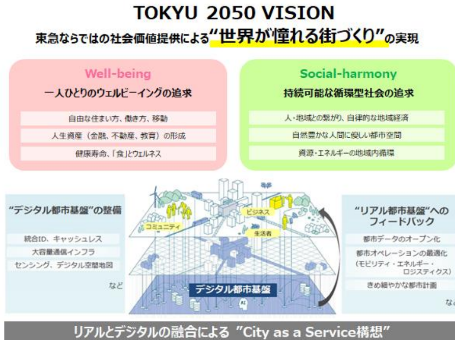
▲TOKYU2050VISIONと CaaS 構想

URL : https://www.tokyu.co.jp/ir/manage/lplan.html (当社HP:長期経営構想について)