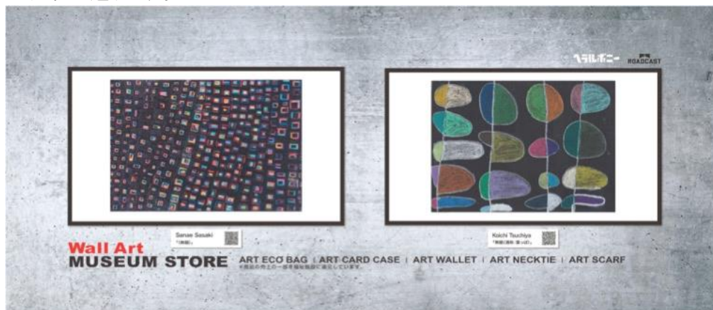
▲Wall Art MUSEUM STOREの展示作品(一部)