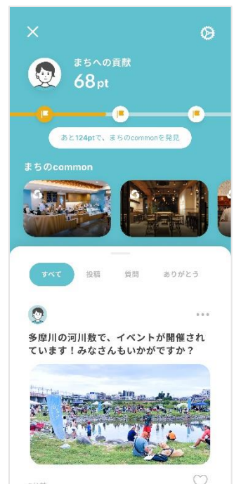
▲③まちへの貢献(マイページ) イメージ