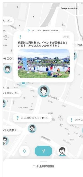
▲①投稿機能(マップ表示) イメージ