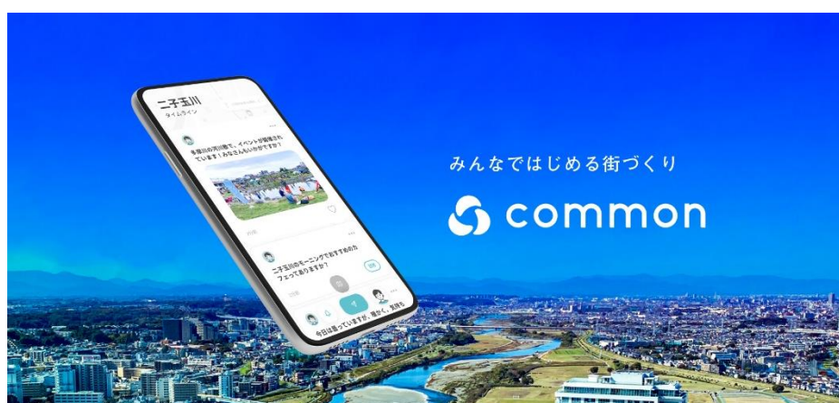
▲「common」アプリ画面イメージ