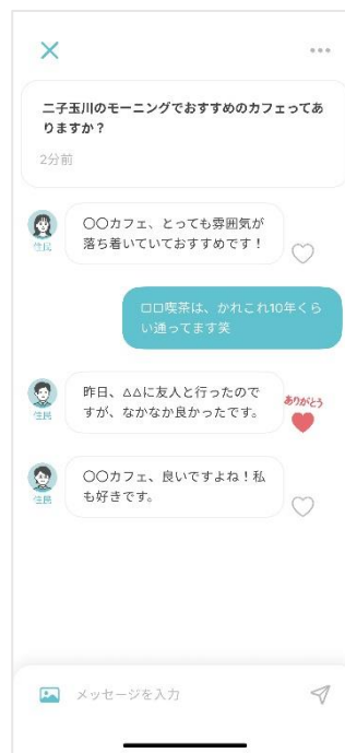
▲②質問機能イメージ