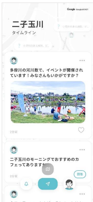
▲①投稿機能(リスト表示) イメージ

投稿、質問・回答といった街での貢献活動を、数値として可視化する機能を盛り込みます。利用者が「同じ街にいる他者」に貢献することで、より街を好きになるきっかけをアプリが作ります。