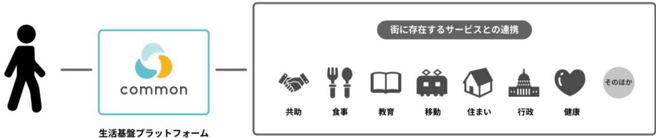
▲地域共助のプラットフォームサービス「common」が目指す姿

本アプリは地域共助のプラットフォームサービスとしてスタートしますが、将来的には、街の中にあるあらゆるサービスとつなげることで、一人一人のライフスタイルに応じた、地域内のさまざまな生活シーンを支える「生活基盤プラットフォーム」となることを目指しています。