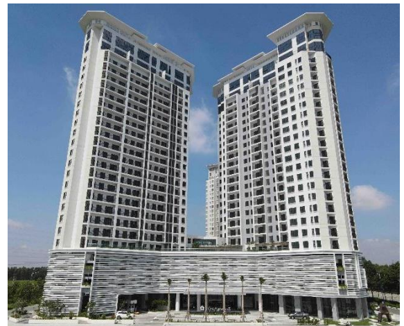
▲SORA gardens II 外観

また、本プロジェクトの建設現場においては、プロジェクトマネジメント業務に携わるベカメックス東急が2012年からのベトナムでの開発経験を活かして作成した独自のチェック項目や評価基準に基づく技術指導を行うことで、2019年5月の着工から竣工までの2年間、無事故・無災害を実現しました。