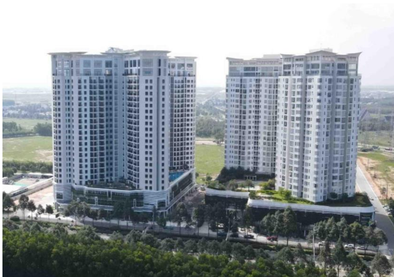
▲SORA gardens II (左)とSORA gardens I (右)