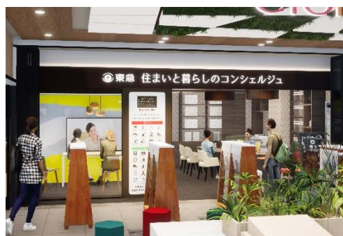
▲エトモ大井町店イメージ