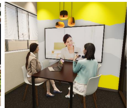
▲リモートカウンターイメージ