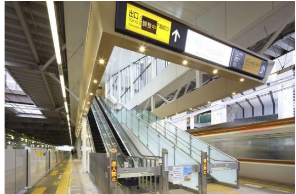
▲東横線・目黒線 武蔵小杉駅