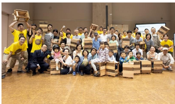
▲椅子制作のワークショップの様子