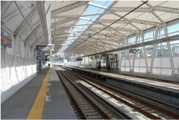
▲大井町線 緑が丘駅