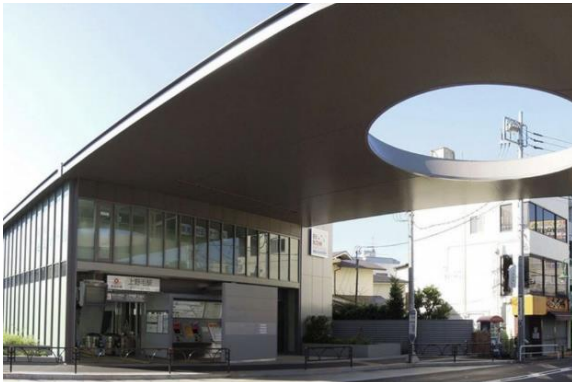
▲大井町線 上野毛駅