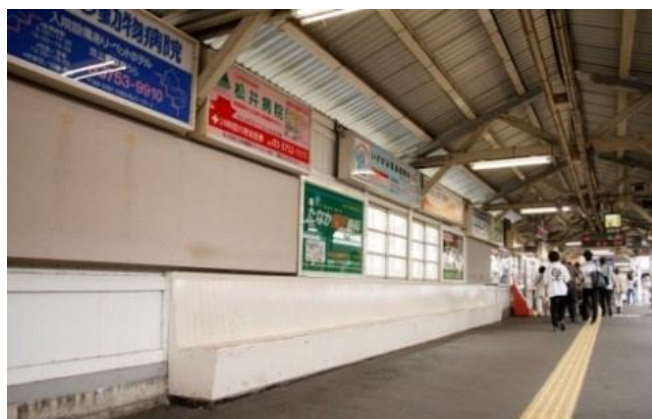
▲旧池上駅に設置されていた長い木製ベンチ