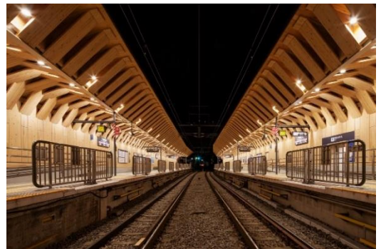
▲池上線 戸越銀座駅