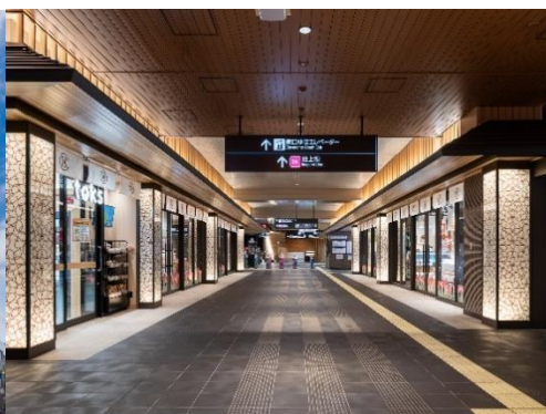
▲2階改札階「池上仲見世」