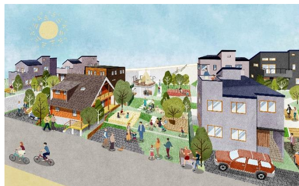
▲本プロジェクトイメージ